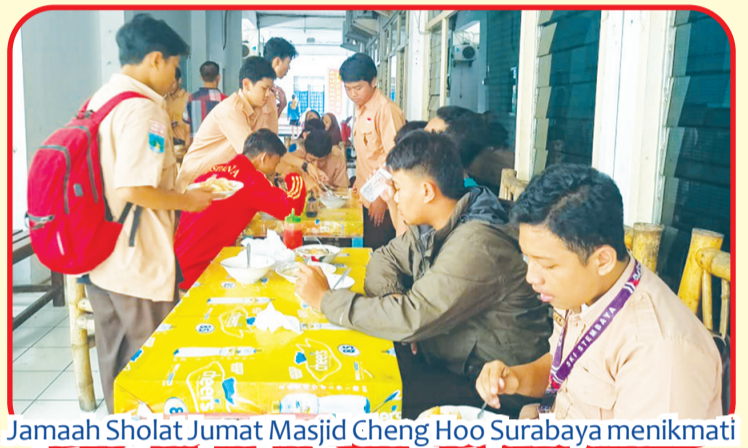
Jamaah Sholat Jumat Masjid Cheng Hoo Surabaya menikmati paket nasi bungkus dan minuman Isotok.