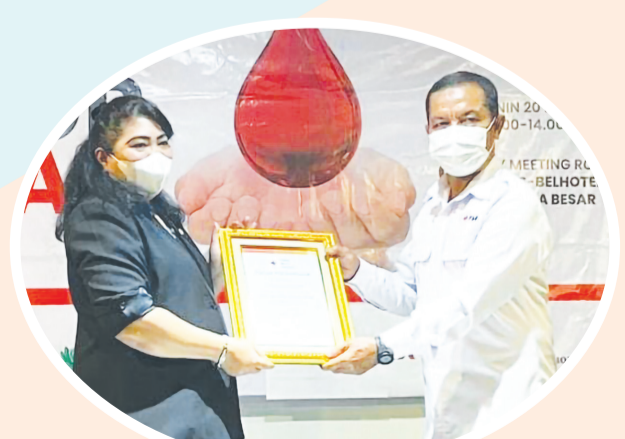
Penyerahan piagam penghargaan dari PMI DKI Jakarta kepada Swiss Belhotel Mangga Besar.