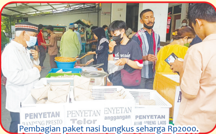
Pembagian paket nasi bungkus seharga Rp2000.

"Minuman Isotok ini bisa meningkatkan imun, atau kekebalan tubuh. Setelah minum Isotok, iso seger, iso senang, iso semangat. Semoga bisa menjadi minuman kekinian dan segar bagi masyarakat," pungkasnya. • anto tze