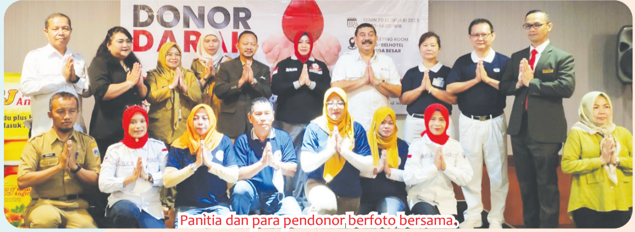
Panitia dan para pendonor berfoto bersama.