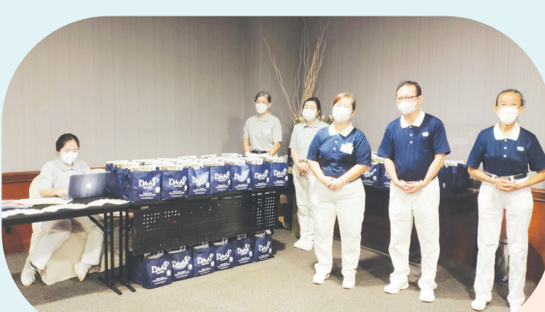
Relawan Yayasan Tzu Chi yang hadir dalam pelaksanaan donor darah.