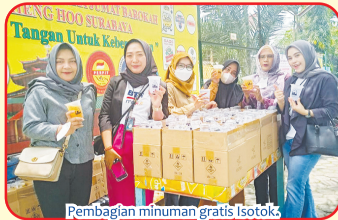
Pembagian minuman gratis Isotok.