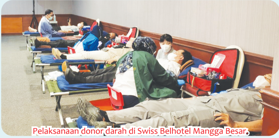
Pelaksanaan donor darah di Swiss Belhotel Mangga Besar.